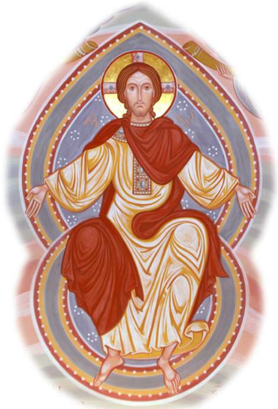
Christ en Gloire – détail du chevet de l'église de Saint-Michel du Var - (iconographe Vadim Garine)

BIENVENUE A L'ORÉE DE SAINT-MICHEL DU VAR